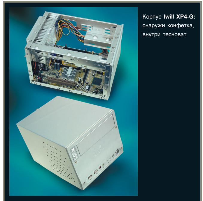
Корпус Iwill XP4-G: снаружи конфетка, внутри тесноват

микросхема кодека AC'97, графический и сетевой адаптеры. Буква G в названии платформы свидетельствует о наличии гнезда AGP 4X (в модели XP4 оно заменено на гнездо PCI). В отличие от платформы Shuttle, здесь процессор Pentium 4 охлаждается обычными вентилятором и радиатором (не входят в комплект поставки). Кроме процессора, вентилятором оснащен