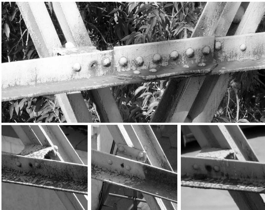
Рис. 3. 3-е промежуточное кольцо 1-й секции, неиспользуемые отверстия.