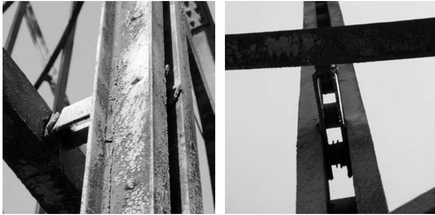
Рис. 2. 1-е промежуточное кольцо 1-й секции, крепление к ноге через скобу.