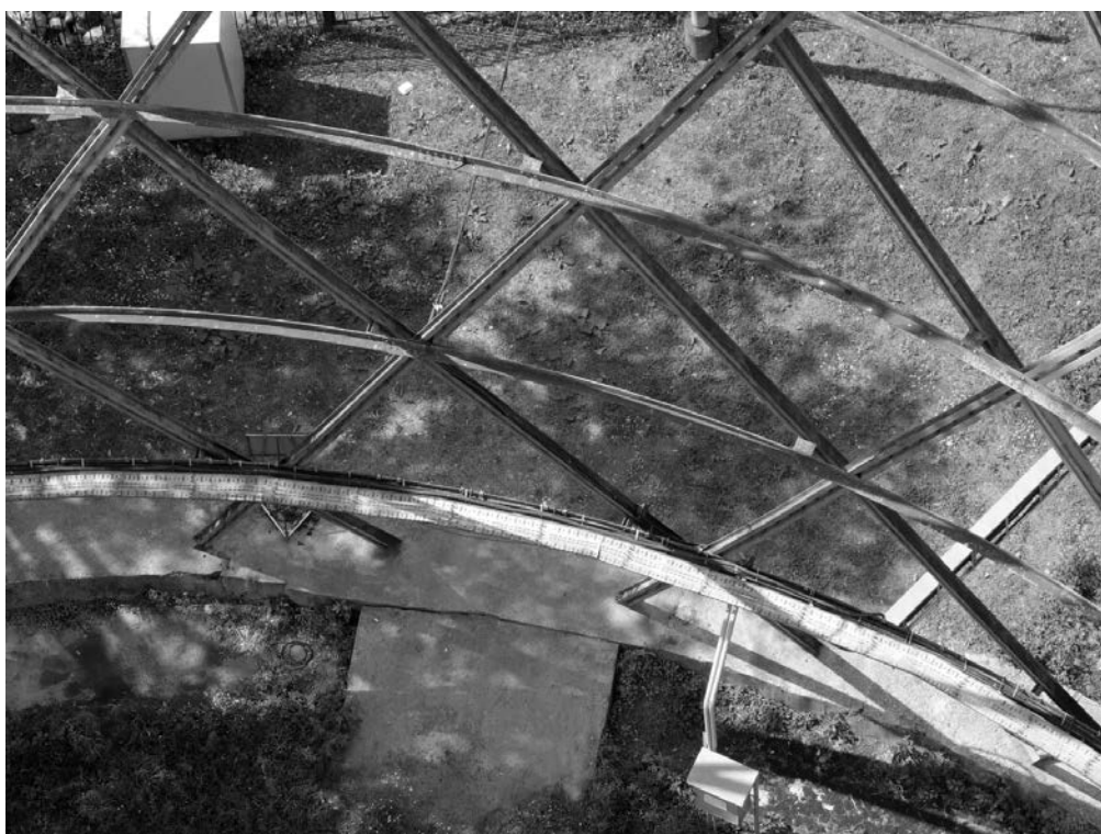
Рис. 1. Для крепления промежуточных колец используются как скобы, так и коротыши.

KEY WORDS: radio tower in Shabolovka Street, historical documents, real dimensions, method of mounting, laser scanning.