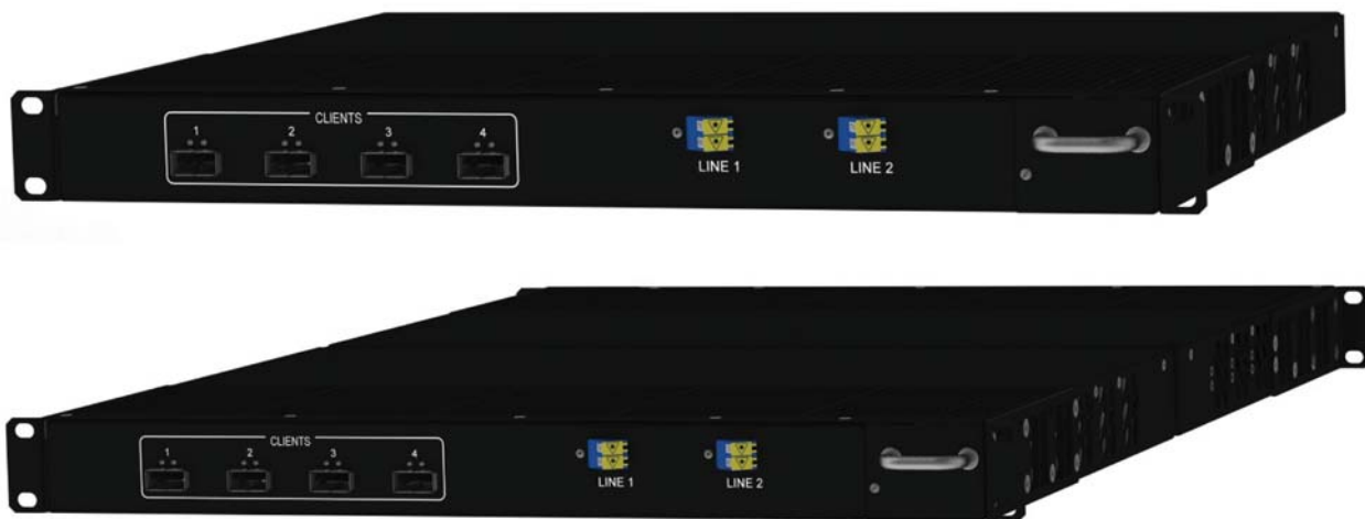
Рис. 1. Система 200G производства "Т8". Ёмкость 400 Гбит/с при глубине 300 мм (вверху) или 800 Тбит/с при глубине 600 мм (монтаж "спина к спине", внизу)